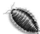
mokrica ali kočič

Kaj o gozdu ti je najbolj ostalo v spominu? Nariši!